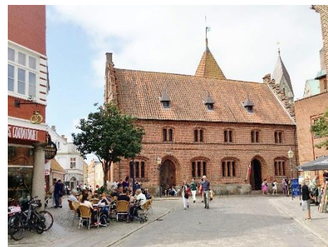
v. Stöckens Plads med Det Gl. Rådhus

Ribe by har hædret ham ved at opkalde det lille torv ved Det Gamle Rådhus efter ham: v. Stöckens Plads. Han var udnævnt til kancelliråd, der på dette tidspunkt dog nærmest kun var en ærestitel. Desuden var han Ridder af Dannebrog.