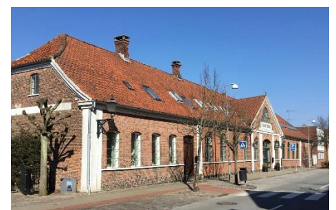
Ribbe Jernstøberis administrationsbygning

I 1973 lukkede støberidelen, og man gik over til udelukkende at fabricere pladejerns-radiatorer og tog navneforandring til Ribbe Jernindustri. I 2018 var det slut. Firmaet gik konkurs og lukkede. Den markante administrationsbygning ud mod Saltgade er nu omdannet til tøjforretning. Resten af bygningerne vil med tiden blive raget ned, og det er planen at rejse et helt nyt boligkvarter på grunden.